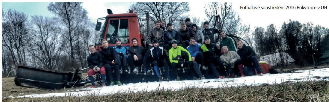
Fotbalové soustředění 2016 Rokytnice v OH

Veselé Vánoce a šťastný nový rok 2017 Vám přejí javorničtí fotbalisté